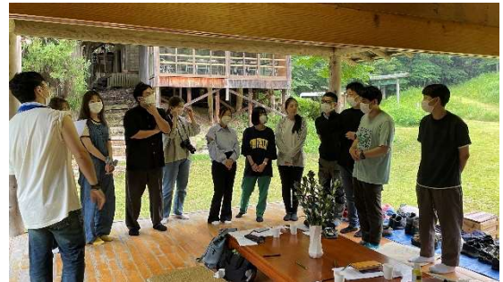
自己紹介を兼ねた交流