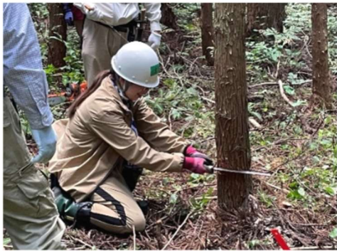
のこぎりを使った間伐体験

間伐作業体験は片寄地区の森林で、紫波みらい研究所「木こり倶楽部」の指導で行われ、どの木を伐れば森にとって良い環境になるのかを教わり、のこぎりを使って伐採しました。伐った木は木質チップに加工され、町内の木質チップボイラーで活用されます。