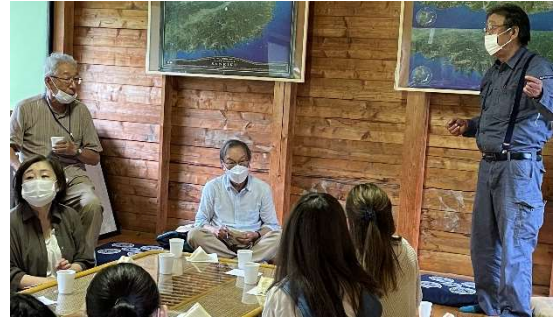
山屋についてのお話を聞く

1日目は、この事業が始まるきっかけとなった山屋の山祇神社で、ゲームをしながら自己紹介を兼ねた交流をしました。初めて参加の学生に先輩方が、自分の間伐体験の感想や、なぜ20年近く続いているのかを語ってくれました。