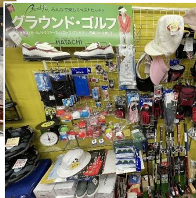
グラウンドゴルフ用品も充実

営業時間：9:00～19:00 ※水曜定休日 場所：紫波町日詰郡山駅 38 TEL：019-672-2650