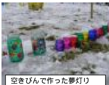
空きびんで作った夢灯り

空きびんに絵の具などで、 かわいい絵をかいて、 ロウソクの灯りとともす 「夢灯り」をつくりま す！