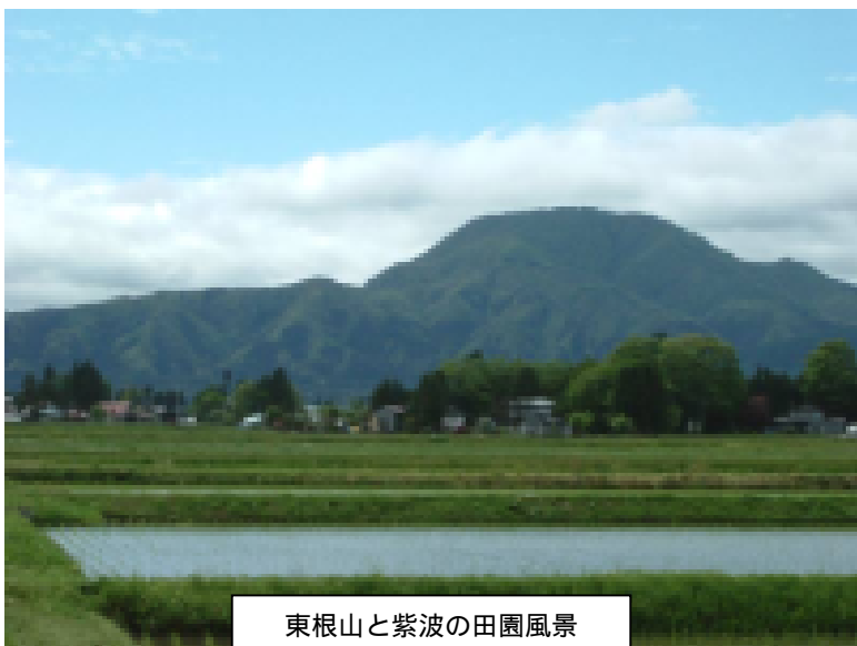
東根山と紫波の田園風景

そこに、BSE問題発生だ。忘れもしない。2001年9月、日本で1頭目のBSE感染の牛が発見された。連日、テレビはイギリスの足が麻痺して立てない乳牛の映像を何十回も映し、あたかも日本中の牛がBSEに感染しているかのように印象付けた。自殺者が出、会社、店は倒産し、畜産業界、食肉業界、日本中が揺れた。皆は正しい知識を持たないままに、風評、マスコミに振り回されたのだ。当時の新聞の隅に、肉牛450頭肥育している方のコメントが載っていた。