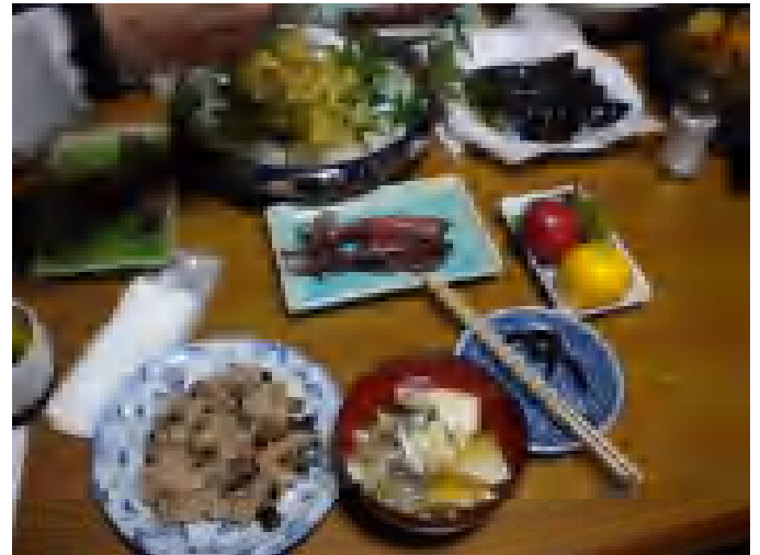
とてもおいしいお料理でした！

「ひばりの家」の名前の由来は、色々説があるようだが、ひばりはいつもピチピチしゃべるので、この集まりにぴったりとすすめてくれる人がいたようだ。