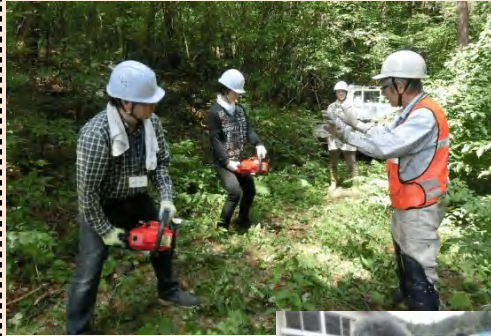
チェーンソーの構え方や、メンテナンスの仕方など森林整備の基本を教わります