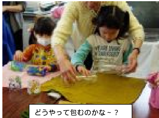
どうやって包むのかな～？