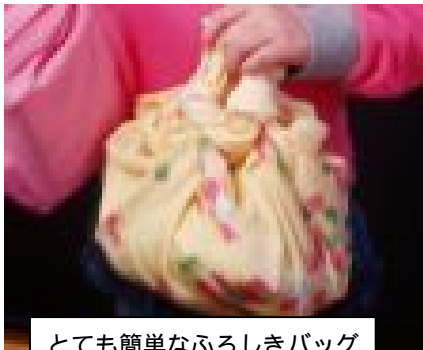
とても簡単なふろしきバッグ

ふろしきはコンパクトにたたんで持ち運べるので、マイバッグに入りきれないほどの買い物をしたときなど、皆さんも利用してみませんか！