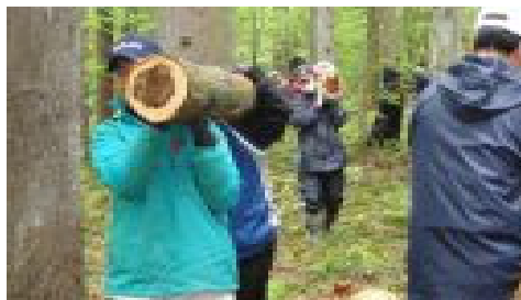
2mの間伐材を運ぶ皆さん

5月12日(土)2年目となる(株)藤村商会の紫波企業の森づくり活動はラ・フランス温泉館の西側山林で実施されました。51人の社員やその家族の人々が参加したので、作業がはかどることはかどること。あっという間に終わってしまいました。その後、大人たちの作業の間、自然観察会を楽しんでいた子どもたちも合流し、なめこの植菌を楽しみました。ここでも社員の皆さんの働きぶりは素晴らしいものがありました。普段の仕事ぶりがうかがえます。その後、ラ・フランス温泉館でバーベキューを楽しんでいただき、昼過ぎには解散。来年もよろしくお願いします。