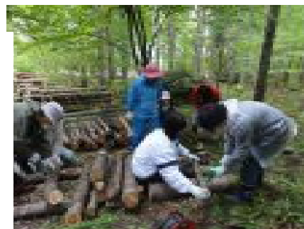
なめこの植菌を楽しむ皆さん