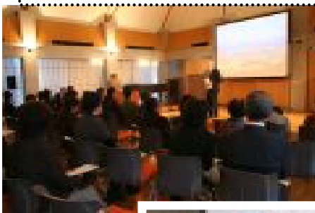
野村胡堂・あらえびす記念館で開催された記念フォーラム

いのちのつながりを考え、自然と調和した暮らし方を学び、話し合い、行動していく場づくりを行っていきます。