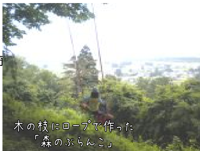
木の枝にロープで作った 「森のぶらんこ」

昨年からの開催を重ねてはいますが、里山×子どもの持つ可能性はまだまだ引き出せると思います。「これをしてはダメ」というのはできるだけ少なく、よその真似でない、地元の里山にこだわって。