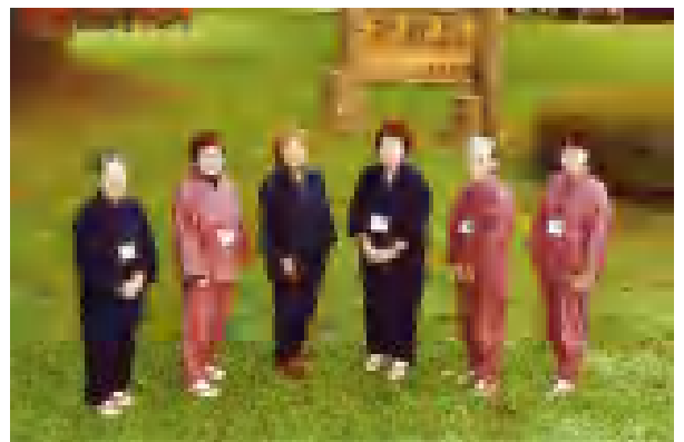
シャ・ベールのみなさん