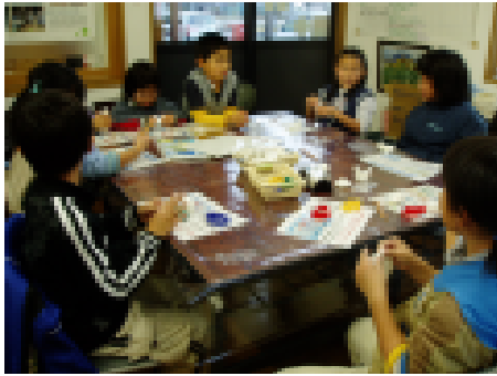
コネコネマイ石けんづくり