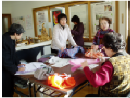
ふるしきの結び方