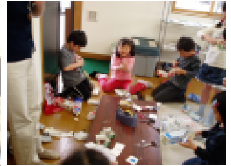
牛乳パックでおもちゃ作り